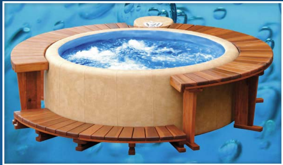
Whirlpool 300 Resort World of Whirlpools +49 (0)201 - 72 66 173