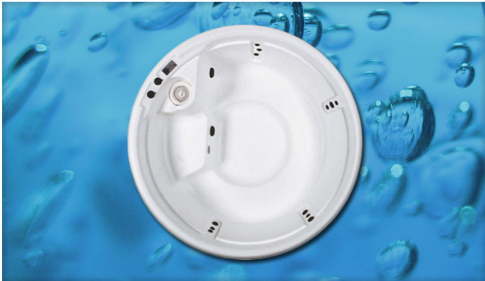
Whirlpool Round Impulse TM World of Whirlpools +49 (0)201 - 72 66 173

info@world-of-whirlpools.de www.world-of-whirlpools.de